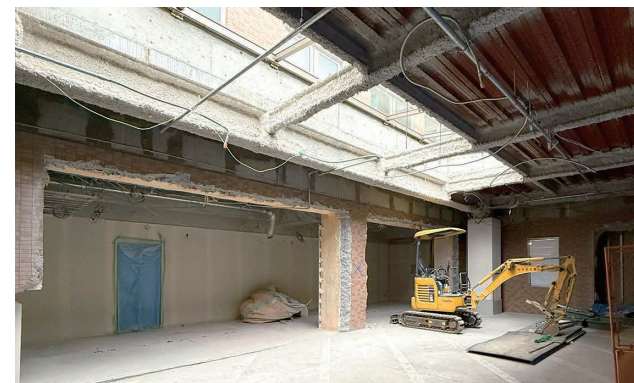
▲ 入退院支援センター工事が始まりました

します。4月にオープンを予定しているこのセンターは、入院前の手続きから退院後の生活支援に至るまでを一貫してサポートするための窓口です。手続きの円滑化を図ることで、患者さまやご家族の皆さまの心理的・時間的な負担を軽減することを目的としています。また、地域の医療機関との連携をこれまで以上に強化し、この倉敷の地で切れ目のない医療を提供できるよう、体制を整えてまいります。