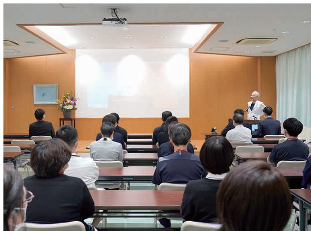
▲ 新年互礼会の様子

明けましておめでとうございます。皆さまにおかれましては、健やかに2026年の新春を迎えられたこととお慶び申し上げます。また平素より当院の診療活動に対し、多大なるご理解とご協力を賜り、厚く御礼申し上げます。