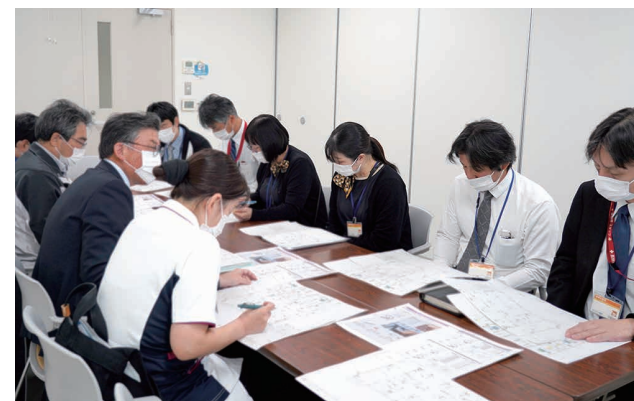
▲ 入退院支援センター打合せの様子

新たな未来に思いをはせて2026年が、皆さまにとって健康で穏やかな1年となりますよう祈念して年頭の挨拶といたします。本年もあたたかいご支援とご助言を賜りますよう、心よりお願い申し上げます。